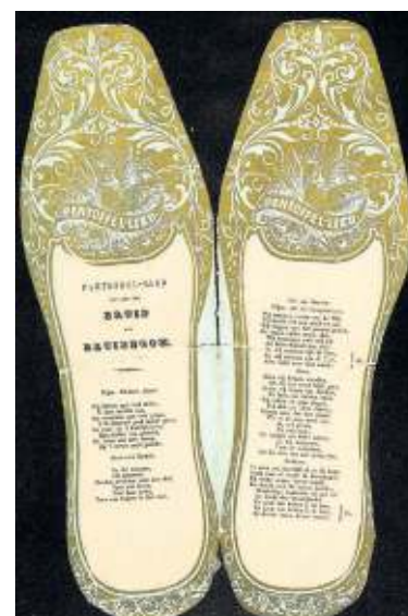
Bruiloftslied, gedrukt in de vorm van twee pantoffels, 19e eeuw.

De verzameling van Swiers bevat vooral liedbladen en -boekjes